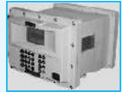
TISI Batch Controller