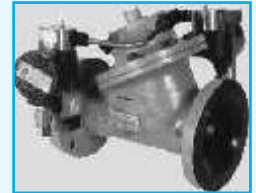
Digital Control Valve- Diaphragm