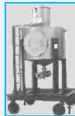
Proving Tank Mobile