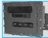
MICROCOMPT Batch Controller