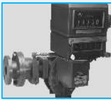
C35 Meter with Preset Valve for Batch Operation