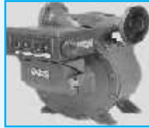
Flow Meter Double Case